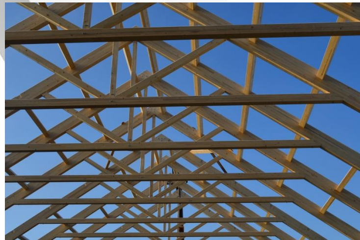
Konstrukcja drewniana hali produkcyjnej