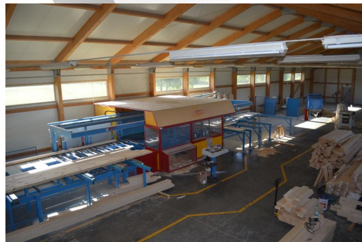
Hala produkcyjna Paproć