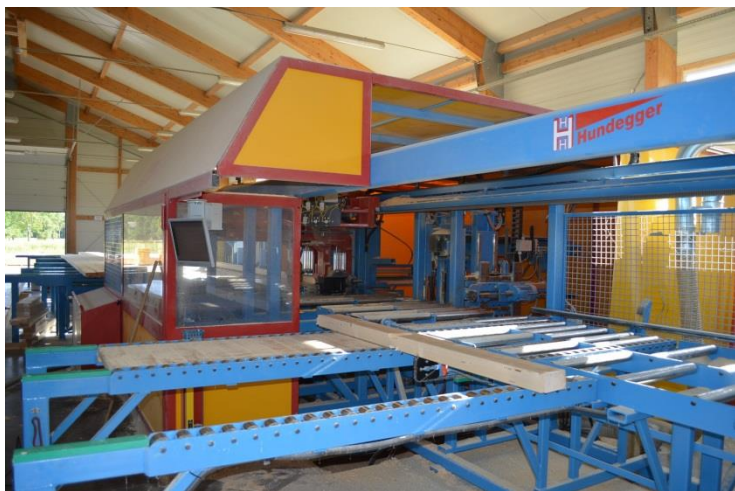
Hala produkcyjna Paproć