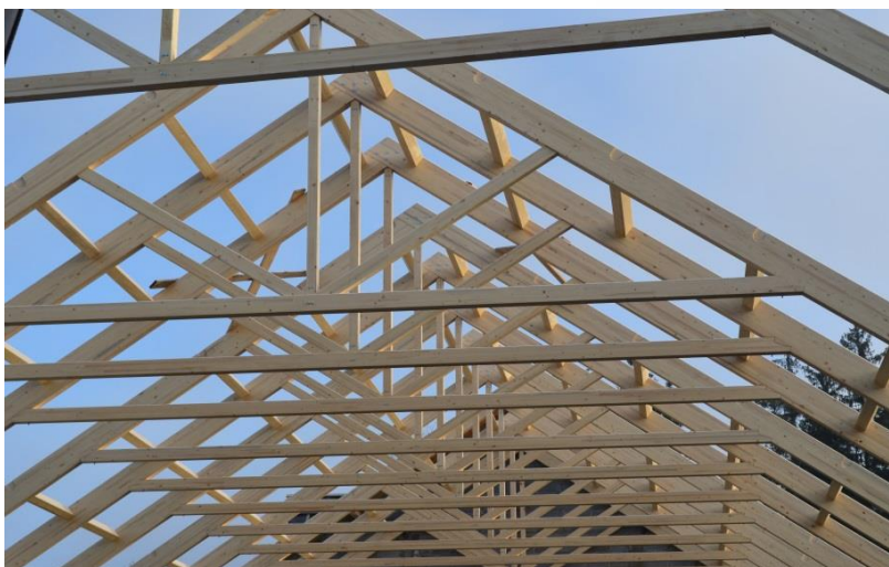
Hala produkcyjna Zakopane