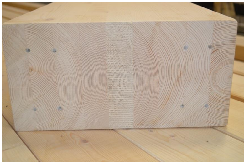
Belka klejona wzmacniana włóknem