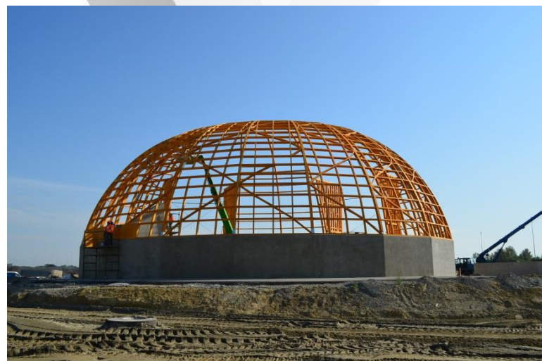
Magazyn soli Tarnów A4