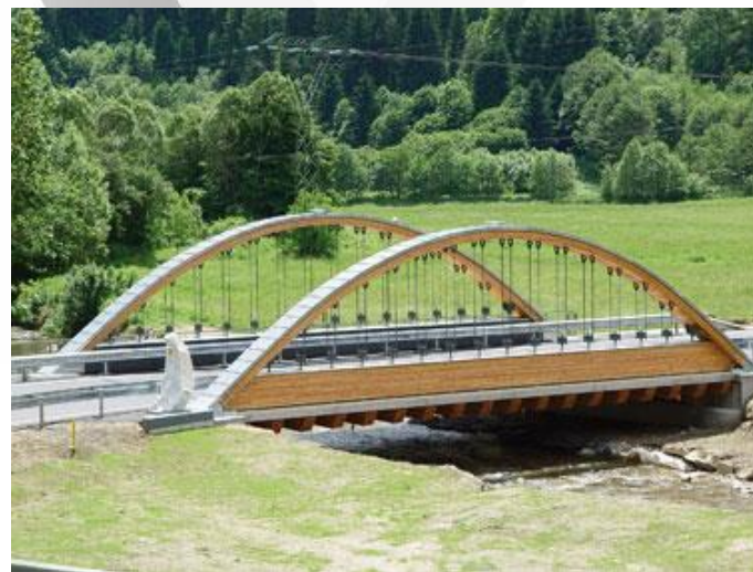
Przykład wykorzystania belek wzmacnianych włóknem